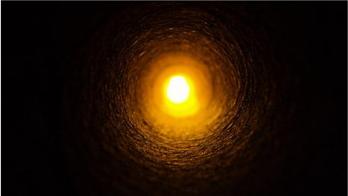
Afbeelding 3: 'het licht aan het einde van de onderwijstunnel' (illustratief gebruikte leidraad doorheen het afstudeerproject)