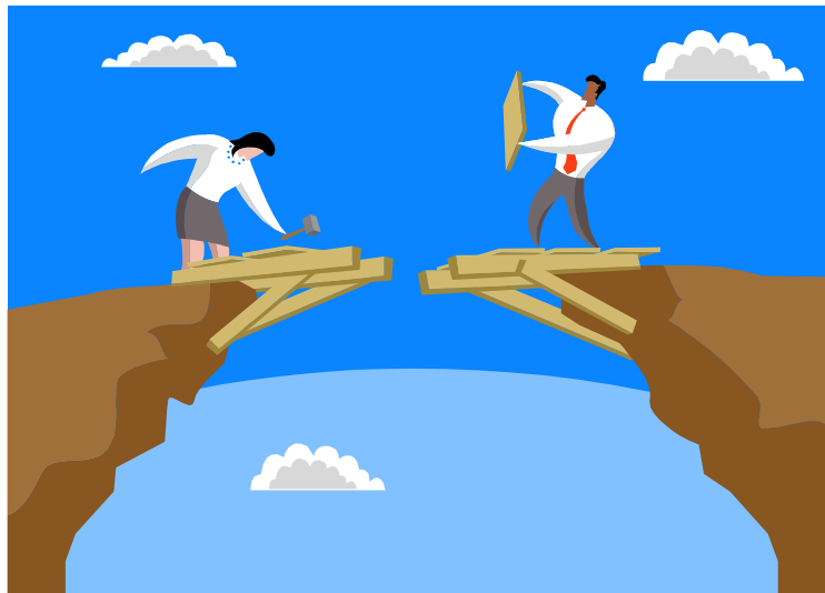
Afbeelding 2: dicht de kloof, een brug te ver? (cartoon met verwijzing naar het laatste hoofdstuk)