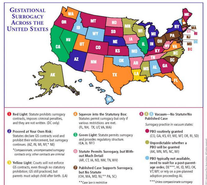
(*) © 2011 American Bar Association – All rights reserved.

In de V.S. is draagmoederschap een wijdverspreid fenomeen: een studie van de Council for Responsible Genetics schat dat er in de periode 2004-2008 maar liefst 5238 baby's op deze manier ter wereld zijn gekomen. Draagmoederschap is echter niet overal in de V.S. juridisch mogelijk. Als onderdeel van het familierecht gaat het immers om een statelijke bevoegdheid. Het hele spectrum komt bijgevolg aan bod: van de District of Columbia met een strafrechtelijk verbod tot staten die draagmoederschap op basis van common law -rechtspraak of gedetailleerde wetgeving mogelijk maken. De V.S. is hierdoor een waar lappendeken. Onderstaande kaart(*) geeft dit perfect weer wat betreft hoogtechnologisch draagmoederschap.