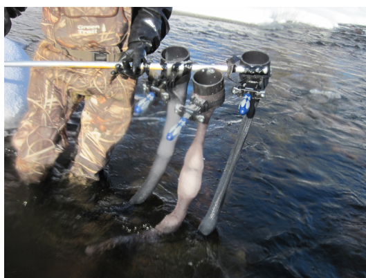
Figuur 3. De frazil sampler met drie gevulde nylonkousen.