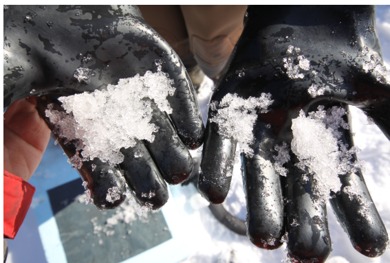
Figuur 1. Een handvol geschept frazil ijs.