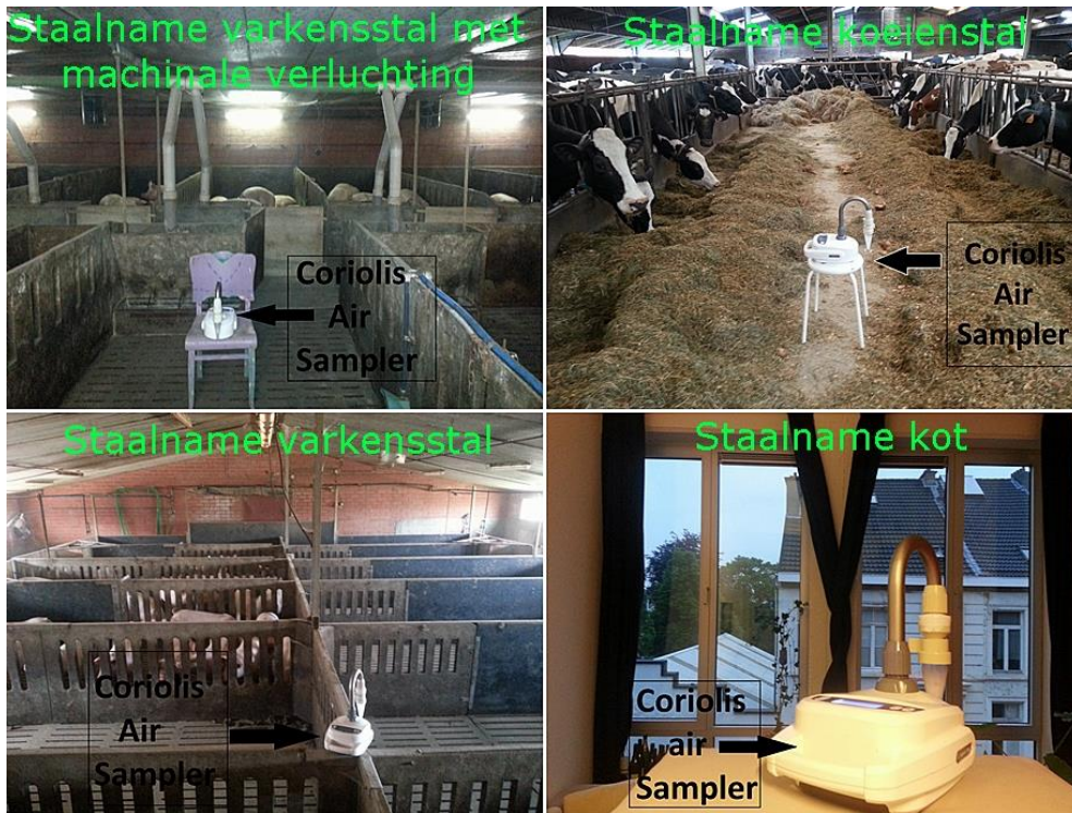
Figuur 1: Foto van de staalnamen