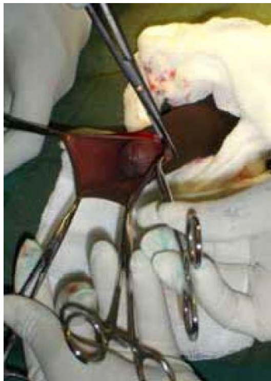
Figuur 2 De Dorsale knip.