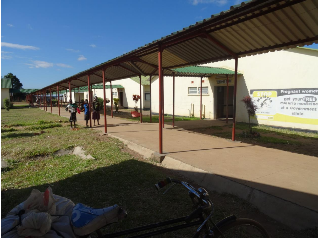
Figuur 5 Het Samfya District Hospital waar ik samen met twee andere drie maanden stage heb gelopen.