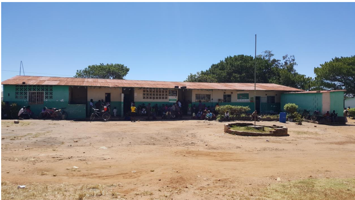
Figuur 4 Het gezondheidscentrum in Samfya waar de circumcisies plaats vonden.